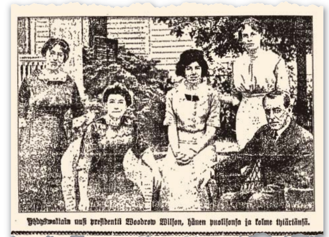
Helsingin Sanomat julkaisi Yhdysvaltojen tuoreen presidentin Wilsonin perhepotretin 17. marraskuuta 1912.